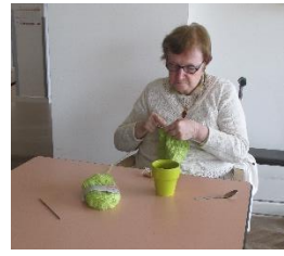
Le 01 : Café Discut'