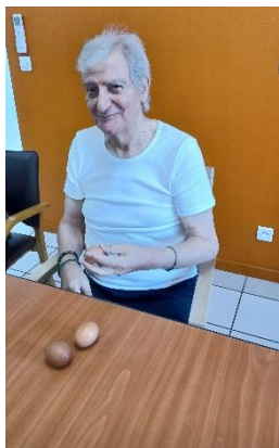
Le 25 : Repas thérapeutique (préparation et repas en extérieur)