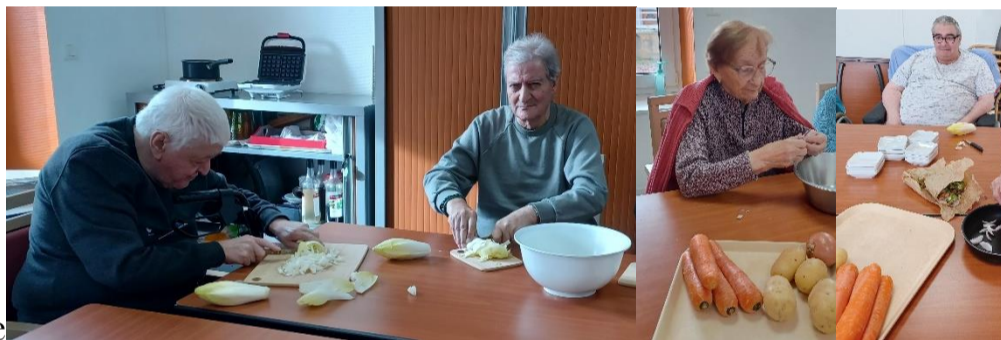
Le 19.01 Repas thérapeutique