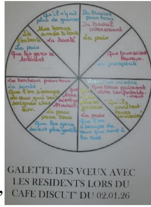
Le 02.01 Le Café Discut' et Galette des vœux des résidents