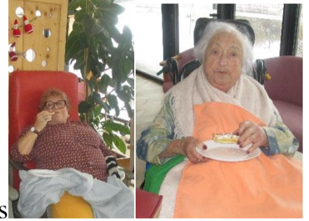
Après-midi Gaufres avec les bénévoles