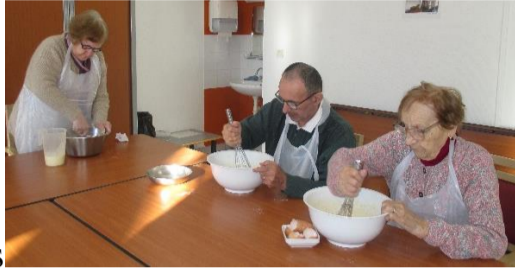
Le 07.01 Cuisine Pâte à Gaufres