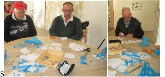
Le 14.01 Galette et activités manuelles avec les jeunes du Conseil Municipal des Enfants