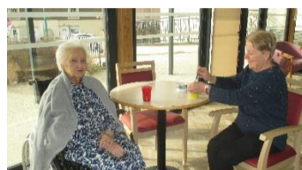
Le 10 : Visite Interactive du Musée du Tissage et de la soierie de Bussières