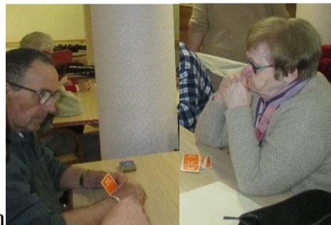
Le 27.01 Belote à la Villa d'Albon